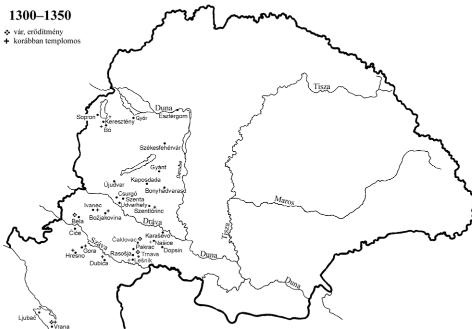
Johannita preceptoriumok a templomos javak átvétele után