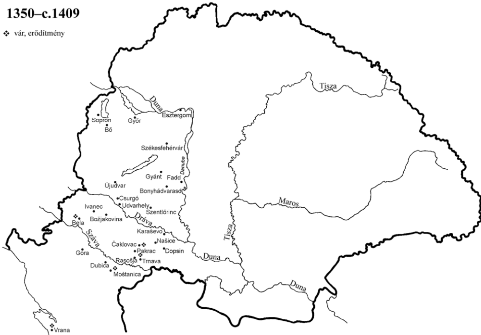
Johannita preceptoriumok a 15. század elejéig

Nemcsak a rendi vezetés vagy a tartomány viszályaira van számottevően több adatunk a 14. századból, hanem az egyes adminisztratív egységekre és azok átszervezésére is. Szembetűnő, hogy a korábban átvett templomos preceptoriumok eltűntek a század végére, birtokait vélhetően az eredendően is johannita preceptorok kezelték, illetve egy részük camera prioralisként a magyar–szlávón (vránai) perjel bevételeit gyarapította. 318 Az átszervezések során a 14. század második felében néhány új, rövid életű preceptorium tűnt fel (Moštanica és Fadd), amelyek eredendően a Rend birtokai voltak, s egy időre önállósodtak. Ezekkel együtt az Anjou-kor végén, illetve a Zsigmond-kor első felében nagyjából két tucat preceptoriummal számolhatunk a Magyar–Szlávón tartományban. A legjelentősebb és